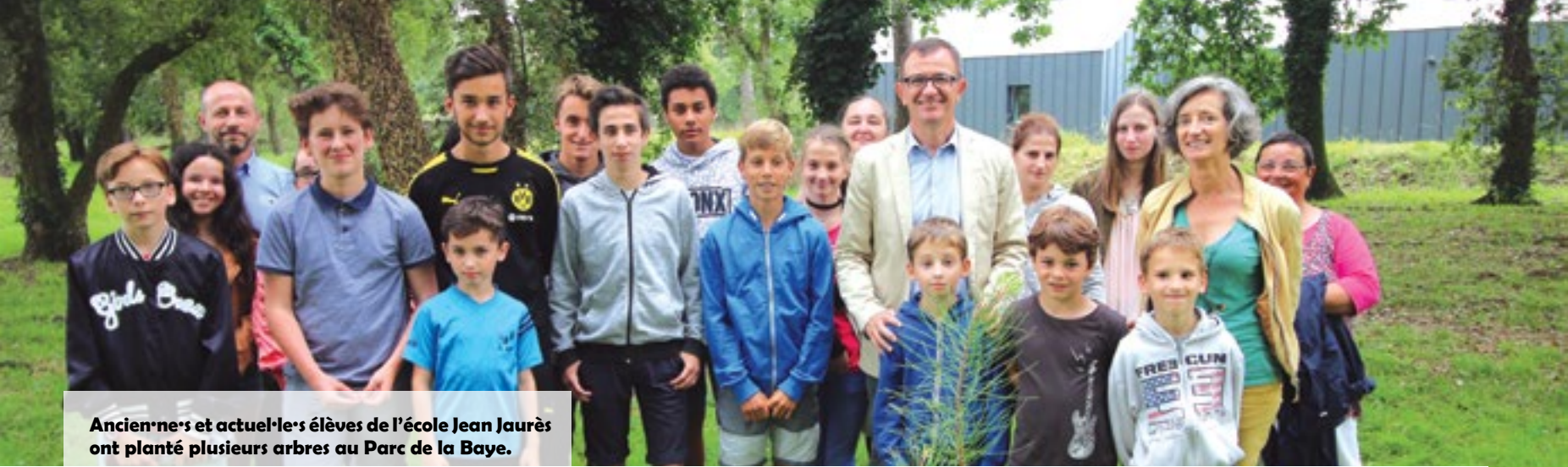
Anciens et actuels élèves de l'école Jean Jaurès ont planté plusieurs arbres au Parc de la Baye.