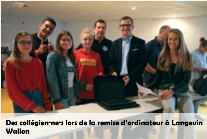
Des collégien·ne·s lors de la remise d'ordinateur à Langevin Wallon