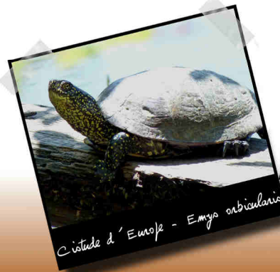
Cistude d'Europe - Emys orbicularis

Ils sont réalisés par les entreprises choisies par le bénéficiaire ou la structure animatrice. Sur certaines actions, le bénéficiaire peut réaliser lui-même les travaux.