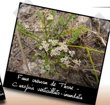
Faux crisson de Thone - Carpobrotus verticillato-inundata