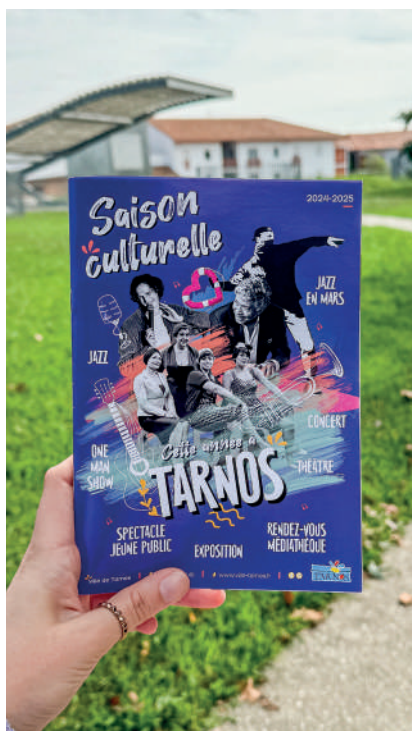
La plaquette culturelle 2024-2025 est disponible en ligne sur le site de la Ville ou à l'Hôtel-de-Ville.

Je tiens à remercier les associations tarnosiennes et leurs bénévoles pour cette mobilisation autour de cet événement Banský. Je le dis souvent mais nous avons la chance, à Tarnos, de bénéficier d'associations aussi nombreuses et actives dans leur rôle de cohésion sociale. Le street art, et la façon dont il pourrait se développer à Tarnos, est au cœur de nos réflexions. L'action culturelle se pense, se discute, s'affine avant de se concrétiser. Mais oui le street art va avoir sa place dans le paysage tarnosien, déjà riche et varié. Des projets sont en cours.