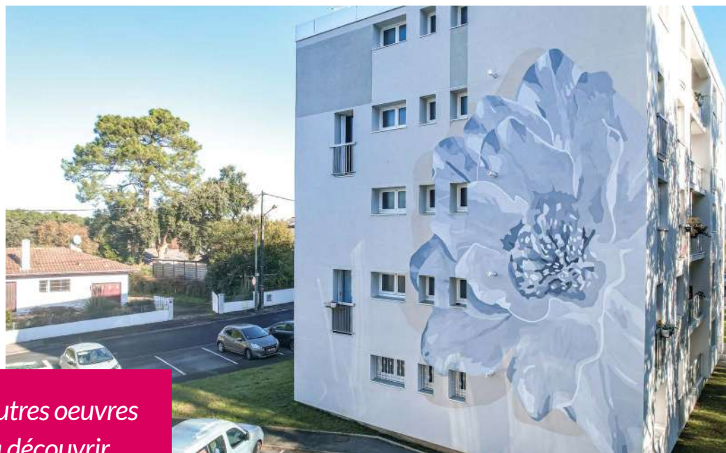
Fleur du Pissot

D'autres oeuvres à découvrir en page 13.