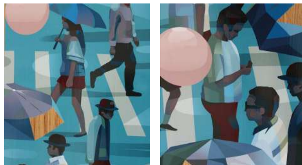
Face nord de la tour - thème de la mobilité