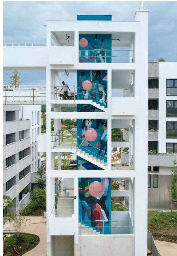
Portraits face sud de la tour