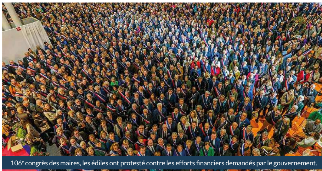
106 e congrès des maires, les édiles ont protesté contre les efforts financiers demandés par le gouvernement.

Face aux coupes budgétaires de près de 10 milliards d'euros imposées par le gouvernement, les maires de France dénoncent des mesures qu'ils jugent confiscatoires. Entre services publics menacés et investissements bloqués, la tension ne cesse de monter. Réunis le 14 novembre en conseil municipal, les élus de Tarnos en appellent à la mobilisation des Tarnosiens.